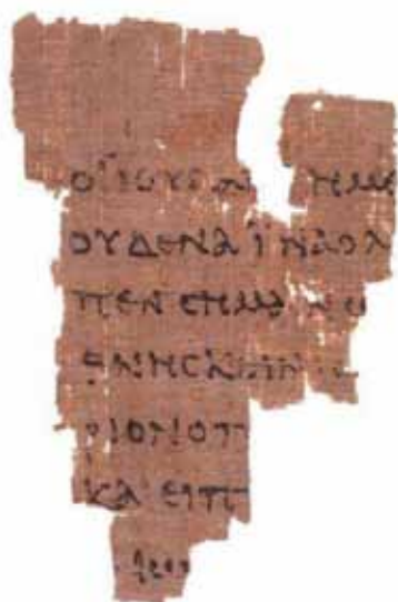
Det eldste bevarte fragmentet av Det nye testamente, Rylands Papyrus, datert til begynnelsen av det andre århundret.